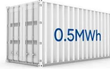
Standard 20ft containers