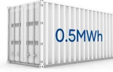
Standard 20ft containers

Feb 25, 2024 · عادةً نوصي، العامل هذا على بناءً من أنظمة تخزين المستخدمين باختيار: سلسلة CSPC CARSPA من أنظمة تخزين الطاقة المنزلية القابلة للتطوير يمكن للمستخدمين زيادة أو تقليل سعة تخزين نظام تخزين الطاقة وفقاً ...