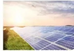
Energy Storage System