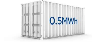
Standard 20ft containers