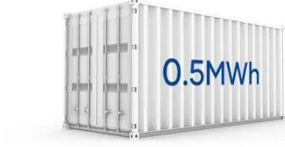
Standard 20ft containers