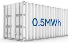
Standard 20ft containers

Aug 14, 2025 · Storage Showdown: A Comprehensive Comparison of Leading Energy Storage Brands In the rapidly evolving landscape of energy storage, choosing the right brand is pivotal ...