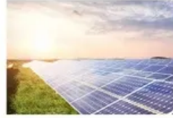
Energy Storage System