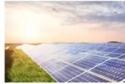
Energy Storage System