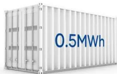
Standard 20ft containers