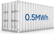
Standard 20ft containers